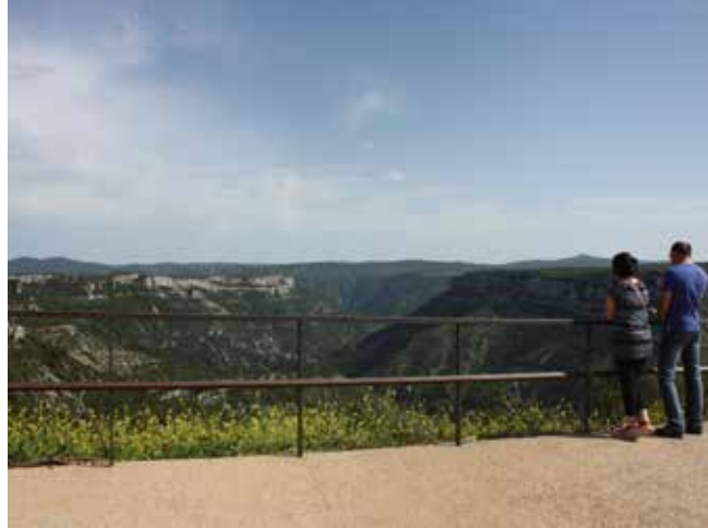
LE BELVÈDÈRE DE LA DOLINE (ALT. 613.01)

Ce point de vue vise l'enfilade des Gorges de la Vis. Une coupe géologique présente les différentes formes du relief et interprète l'évolution des paysages des parois rocheuses.