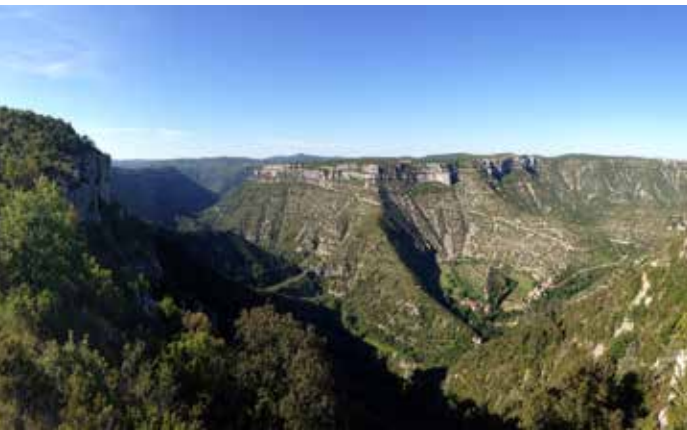
LE BELVÈDÈRE DE LA CASCADE (ALT. 617.30)

Sur cette place gagnée sur le vide, une grande maquette, permet de découvrir les méandres des Gorges de la Vis.