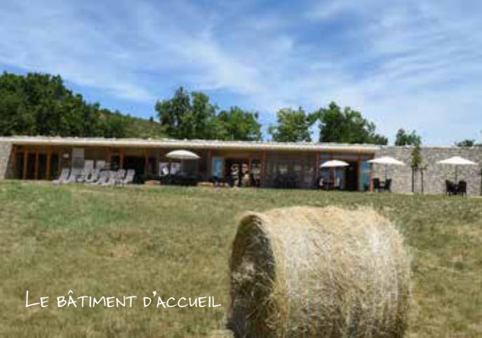
LE BÂTIMENT D'ACCUEIL